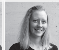
Andrea Stutz Werbung / Medien