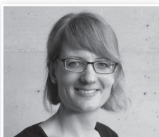
Angela Zimmermann Dekoration