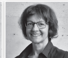
Heidi Bucher Werbung / Medien