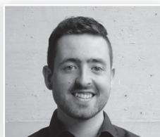
Fabian Fischer Bau